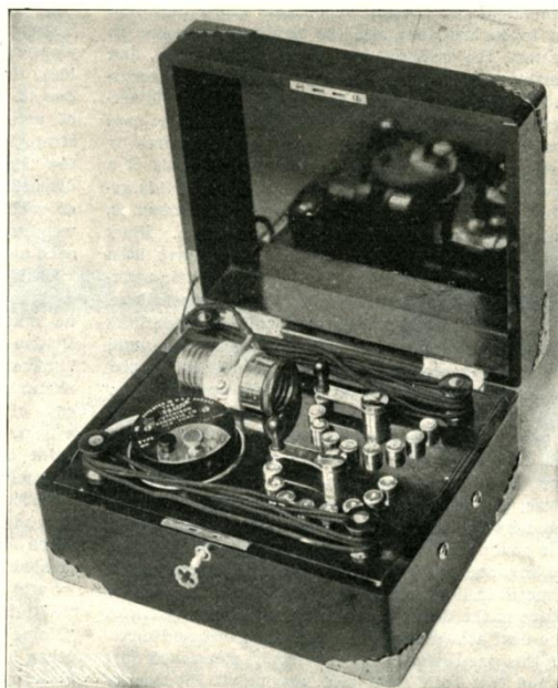
Figur 2: Massacon, elektrisk øremassageapparat fra firmaet The Hutchinson Acoustic Co. Billede fra Scientific American 1903.

bevæges individuelt og dermed ikke kan overføre lyd fra trommehinden til det indre øre". Man mente dengang, at ca. 65% af de personer der havde høretab samtidig led af en kataralsk tilstand, der kunne behandles med phono-elektrisk massage af øret.