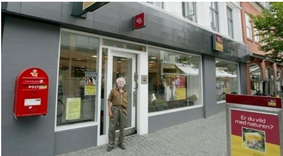
Spidsmus foran den daværende BG Bank i Slotsgade i Hillerød.