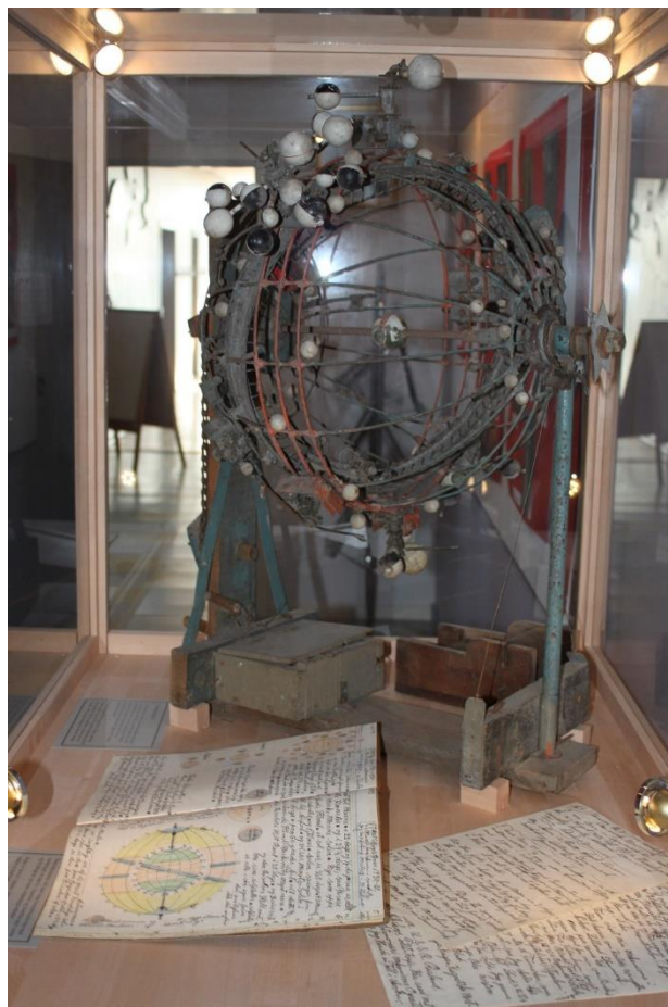
Himmelmaskinen udstillet i Ravensborg arkiv. Kædetrækkes anes i venstre side. Alle de små planeter er placeret, så de kan bevæges. Under maskinen bogen med Himmelmesterens levnedbeskrivelse. Foto ved Claus Nielsen, 2015.

Folk var ikke altid helt forstående, og særligt datidens børn kunne finde på at kaste med sten efter Himmelmesteren, når han kom cyklende i sin uniform.