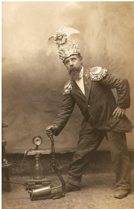
Himmelmesteren poserer med sin centrifugalmaskine iført sin 'uniform'. Foto fra ca. 1917.